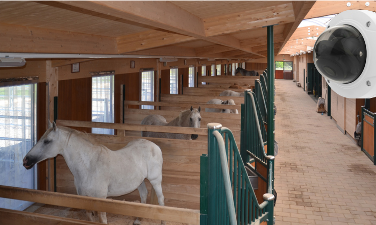
toujours possible de les observer sans les déranger grâce à la vidéosurveillance.