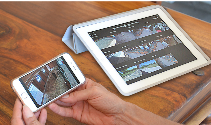
Les images sont disponibles en temps réel ou archivées pendant 30 jours.