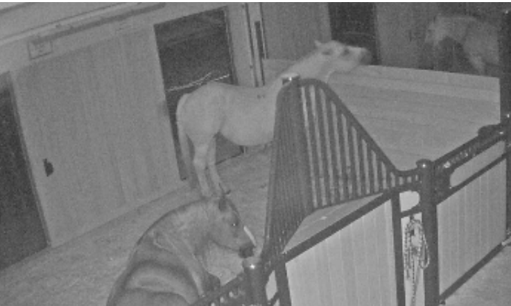
Bien surveillés même pendant la nuit grâce à des caméras à éclairage infrarouge.